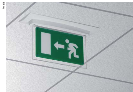
Скрытый потолочный монтаж (монтажный комплект приобретается отдельно)