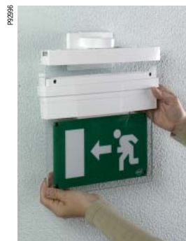
Быстрый настенный/боковой монтаж с кронштейном (в комплекте)