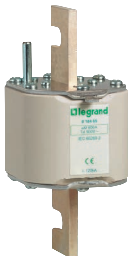
0 184 85